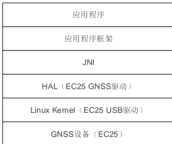
图 1：Android GNSS 架构（以 EC25 为例）

Android GNSS 驱动架构如下图所示，其中下层为上层服务，数据由下至上逐层传递。移远通信 GNSS 驱动在 HAL 层运行。